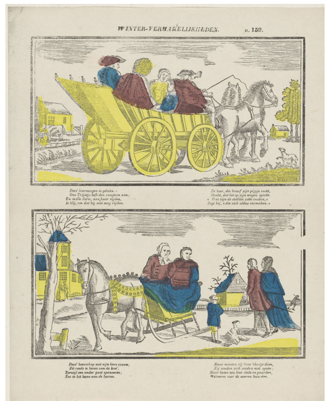
Afb. 6. De prent 'Winter-vermakelijkheden' waarop de pijp van afbeelding 4 is gebaseerd.

De prent waarop de afbeelding op deze pijp is gebaseerd (afb. 3) was een uitgave van A.W. Sijthoff in Leiden. Sijthoff startte de uitgave van deze prentenserie in 1854 en was actief als uitgever tot omstreeks 1891. De serie prenten werd uitgegeven onder goedkeuring van de Maatschappij tot Nut van 't Algemeen.