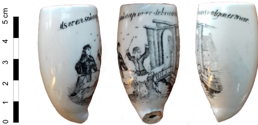
Afb. 7. Pijp met het spreekwoord 'Als er een schaap over de brug is volgen er meer'. Hoogte 6 cm. Vermoedelijk was dit een rondbodempijp.