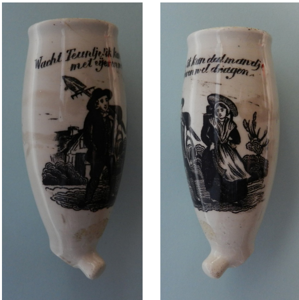
Afb. 10. Pijp met de tekst 'Wacht Teuntje ik kan dat mandje met eieren wel dragen' Hoogte 8,3 cm. Collectie Ruud Stam, foto Bert van der Lingen.

gevestigde firma Glenisson & Van Genechten. Deze Turnhoutse firma (1833-1900) wijzigde de titel van de prent in 'Winter-vermakelijkheden' (afb. 6). 10 Onder deze prent stond onder andere de tekst die we ook op de tabakspijp vonden: 'Deez boerenwagen is gelaan / Ons Trijntje heft den zangtoon aan / En malle Joris aan haar zijden / Is blij omdat hij mee mag rijden'.