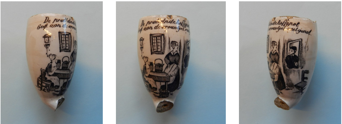
Afb. 2. Pijp met de tekst en voorstelling: 'De pruttelende koffijpot geeft aan de vrouwtjes veel genot'. Collectie Martin Vermeulen

De Bordollo pijpen waren toen al zo populair dat deze werden nagemaakt. Waarschijnlijk gebeurde dit door de firma Jacobi, Adler & Co uit Neuleiningen in Duitsland op weinige kilometers afstand gelegen van de fabriek van Bordollo in Grünstadt. 4