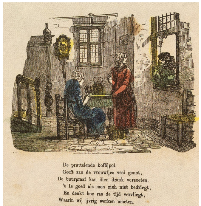
Afb. 3. Een prent uitgegeven door Sijthoff uit het eind van de 19e eeuw, met de voorstelling en tekst die gebruikt is voor de pijp op afbeelding 2. 6

Van enkele van deze pijpen is de oorspronkelijke afbeelding, waarop de afbeelding op de pijpen gebaseerd is, gevonden en afgebeeld. Opmerkelijk is dat deze pijpen in Duitsland met Nederlandse teksten en Nederlandse voorstellingen zijn gemaakt. Hier en daar zijn dan ook verschrijvingen in de teksten zichtbaar. Over de precieze datering van deze pijpen bestaat geen duidelijkheid maar vermoedelijk zijn ze laat 19e eeuws. Immers