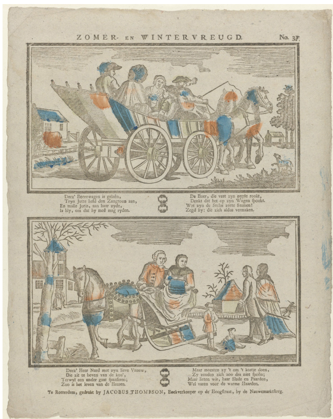
Afb. 5. De prent 'Zomer en wintervreugd'. Deze prent was dus een voorloper van de prent (afb. 6) waarop de tekst op de pijp is gebaseerd.