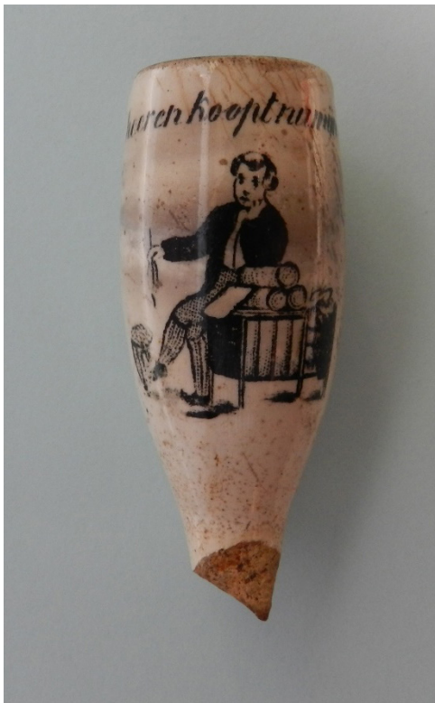
Afb. 13: Pijp met de tekst 'komt Heeren koopt mijn laken'. Hoogte 5,8 cm. Collectie Ruud Stam.

Noordwest-Duitsland naar Nederland door de slechte economische omstandigheden in Duitsland. Onder de mensen die naar Nederland trokken waren ook vele marskramers. Een aantal grote winkelketens die in Nederland zijn opgericht hadden als oorspronkelijke oprichter een van deze marskramers.