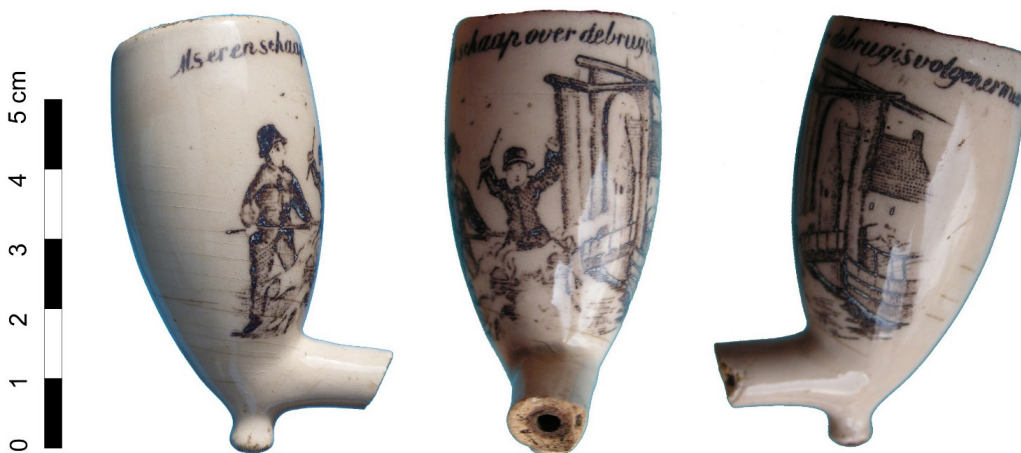
Afb. 8. Een ander model pijp met een iets ander plaatje met het spreekwoord 'Als er een schaap over de brug is volgen er meer'. Hoogte 6 cm.