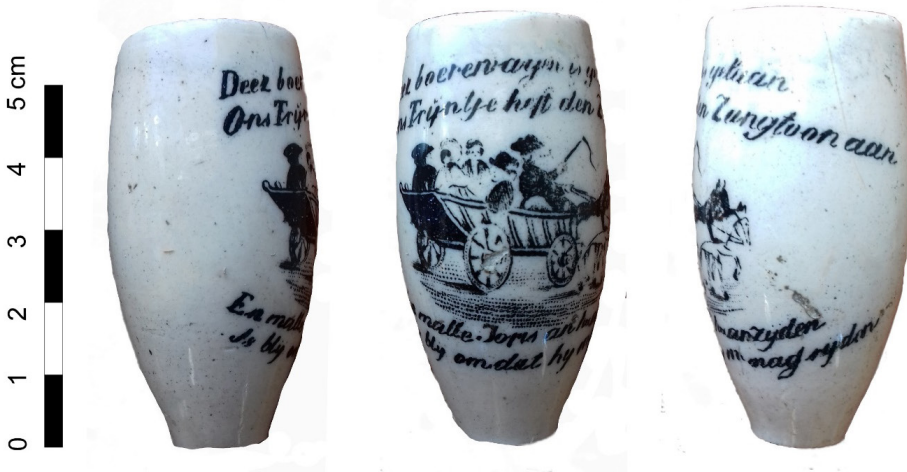
Afb. 4. Pijp met de boerenwagen. Gevonden te Amsterdam, datering laatste kwart 19e eeuw. Hoogte van het fragment circa 6 cm. Collectie en foto privéverzamelaar.