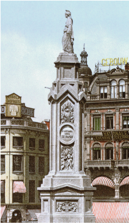
Afb. 15. Het beeld 'Naatje van de Dam'.

nieuw leven in te blazen, maar ook door de vele kanalen die dan worden aangelegd. Alleen deze pijp heeft een gekleurd plaatje en past dus niet geheel in de hiervoor getoonde serie.