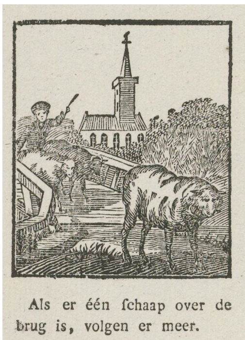
Afb. 9. Prent uit de tweede helft van de 19e eeuw met dezelfde tekst als de pijpen van afbeelding 7 en 8.

op goedkoop papier uitgegeven. Deze goedkope prenten waren vaak ongekleurd of werden met een grove vlekkenkleuring verkocht. Duurdere prenten werden met behulp van sjablonen van kleur voorzien. Winkeliers of (mars)kramers verkochten de prenten per stuk en onderwijzers gaven soms een prent als beloning aan een leerling. 7