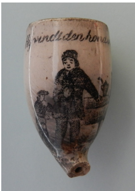
Afb. 11. Pijp met de tekst 'Hij vindt den hond in den pot'. Hoogte 5 cm. Collectie Ruud Stam, foto Bert van der Lingen.

In dit geval (afb. 7 en 8) stond er een herder op de tabakspijp afgebeeld die de schapen over de brug heeft gejaagd. Een duidelijke verwijzing naar het (19e