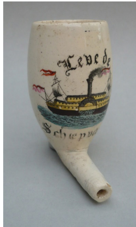
Afb. 16. Pijp met de tekst 'Leve de Scheepvaart'. Hoogte 5,6 cm. Collectie Ruud Stam, foto Bert van der Lingen.

De duidelijk toe te schrijven afbeeldingen zijn allemaal afkomstig van voor die tijd in Nederland bekende en wijdverspreide volks- en centsprenten. Het is aannemelijk dat de meeste nog niet nader te duiden plaatjes ook ontleend zijn aan volks/centsprenten. Immers deze opvoedkundige prenten laten veelal onderwerpen zien als spreekwoorden (zie hond in de pot), beroepen en ambachten (lakenkoopman) en historische gebeurtenissen en stadsgezichten (Naatje van de Dam). De afbeelding van Teuntje blijft in dit geheel een raadsel maar zal vermoedelijk ook aan een cents/volksprent ontleend zijn. Met andere woorden de afbeeldingen op deze laat 19e eeuwse pijpen waren meestal geïnspireerd op alledaags bekende en wijdverspreide afbeeldingen.